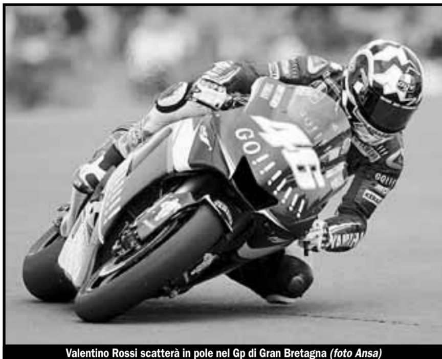
Valentino Rossi scatterà in pole nel Gp di Gran Bretagna